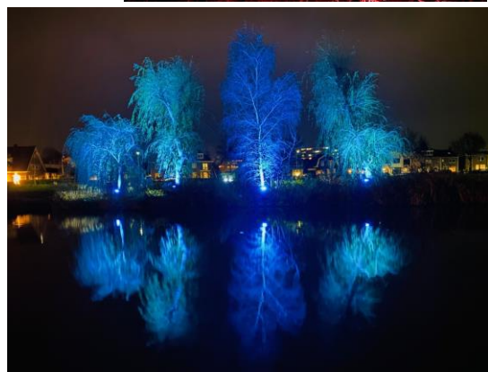
impressie van Doetinchem VerbindT december 2021