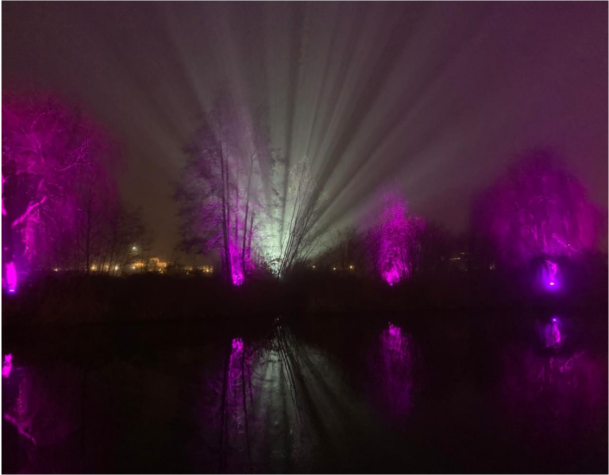
Doetinchem VerbindT, langs de Oude IJssel, Mark Tennantplantsoen en de Catharinatoren