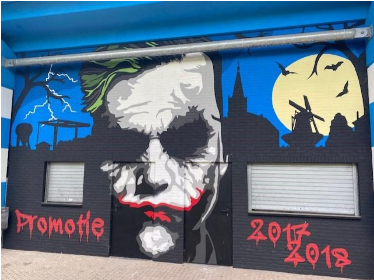
Een rondleiding door stadion De Vijverberg in samenwerking met De Graafschap