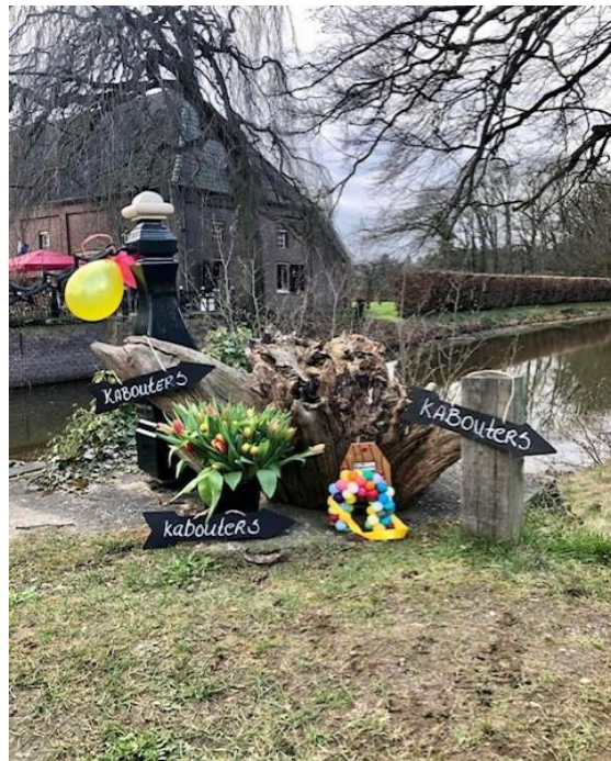
Opening van de kabouterroutes in het museum en bij Kasteel Slangenburg